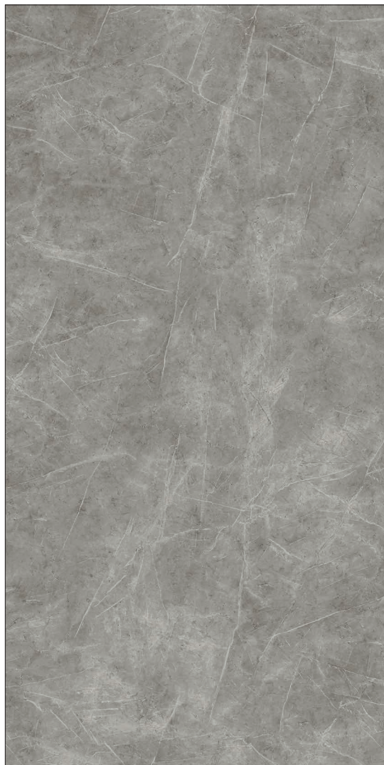
163 x 324 x 1.2 cm (64" x 128" x 0.5") Mat WA.MO.GSL.64x128.MT