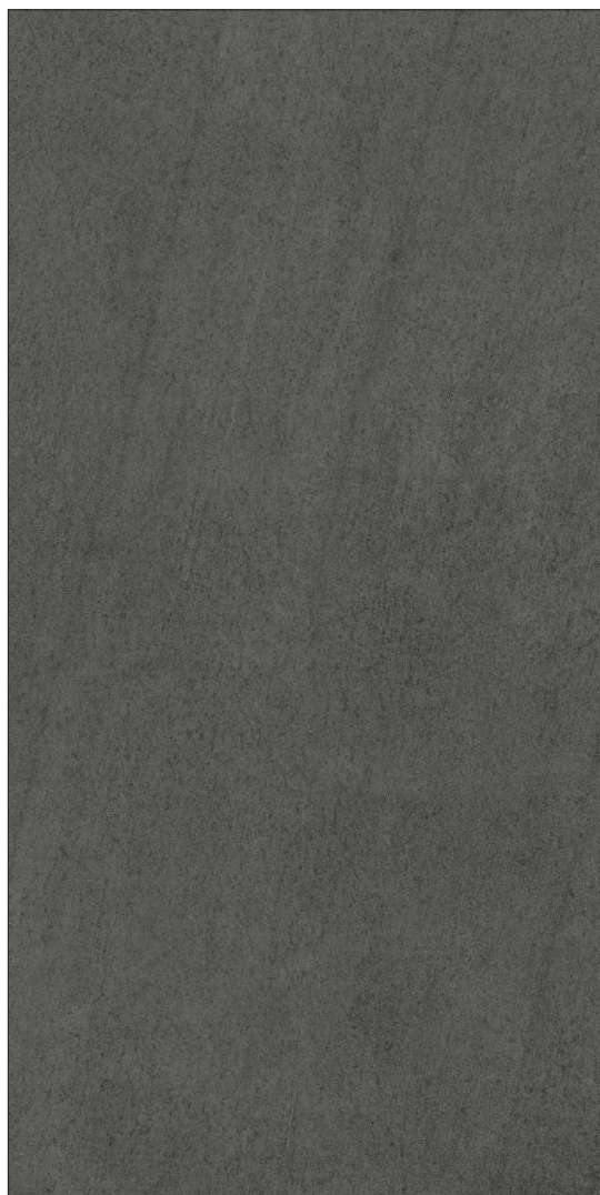
163 x 324 x 1.2 cm (64" x 128" x 0.5") Mat WA.MO.BSV.64X128.MT