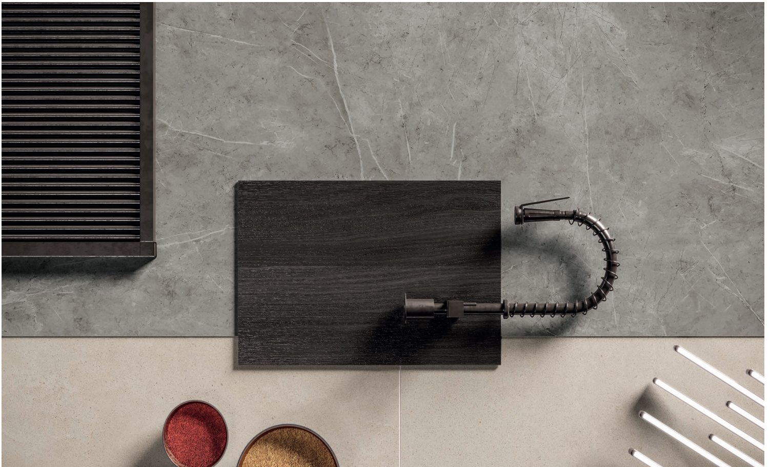
PIERRE GRIS PÂLE