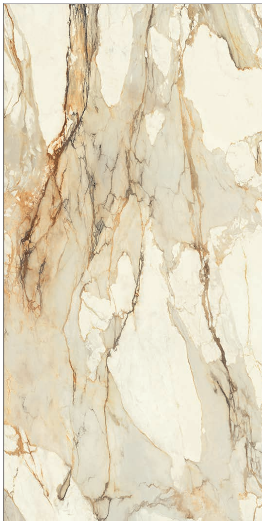
CALACATTA ANTIQUE Bookmatch A & B