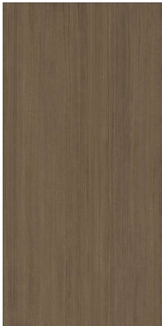
163 x 324 x 1.2 cm (64" x 128" x 0.5") Mat WA.MO.NCN.64X128.MT

Tous les items présentés dans ce document font partie du programme d'inventaire Olympia. Pour les commandes spéciales, veuillez contacter votre représentant de Tuiles Olympia.