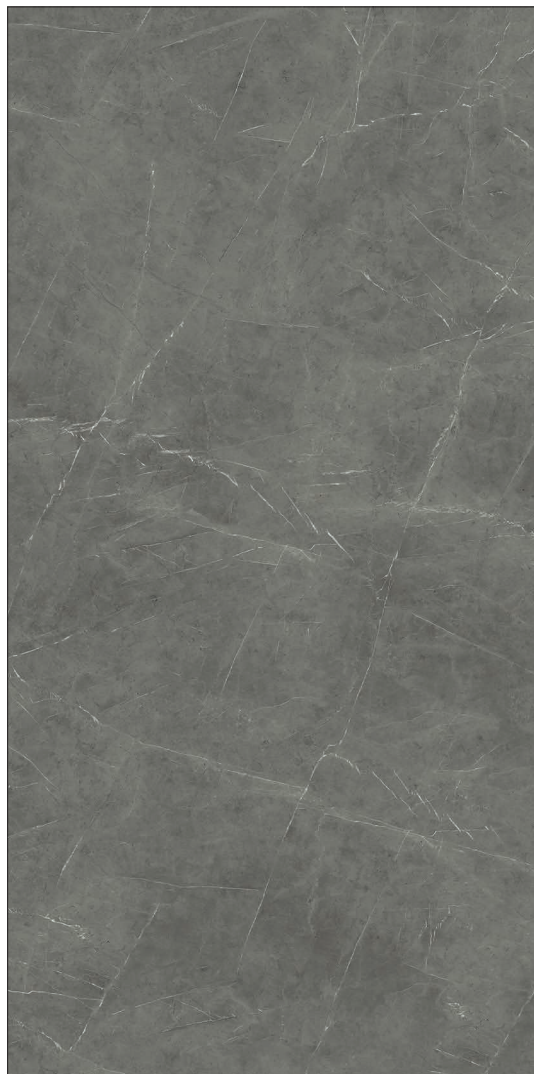
163 x 324 x 1.2 cm (64" x 128" x 0.5") Mat WA.MO.GST.64x128.MT

Tous les items présentés dans ce document font partie du programme d'inventaire Olympia . Pour les commandes spéciales, veuillez contacter votre représentant de Tuiles Olympia.